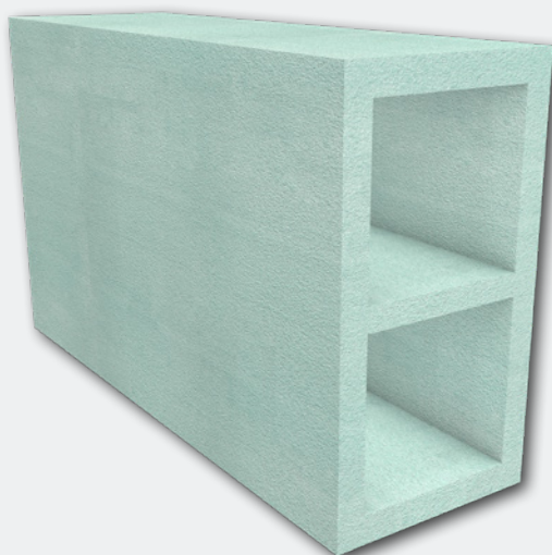
AIRUNIT Wanddurchführung 500 eckig PET Dezentrale Wohnraumlüftung Art.-Nr. 4 02 004