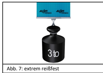
Abb. 7: extrem reißfest