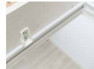
Umlaufende Doppeldichtungen und Eckdichtungen