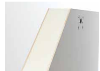
Hochwertig gedämmter Deckel