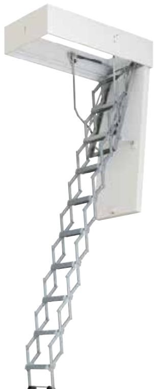
Die Bodentreppe mit TOP-Wärmedämmung und Scherentreppe aus Aluminium