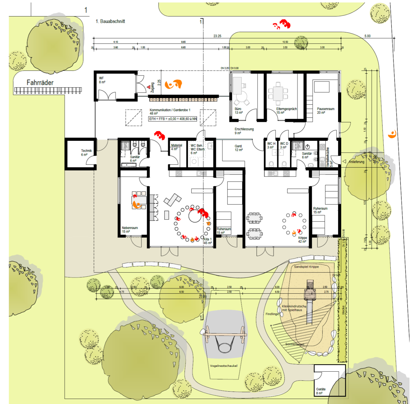
Grundriss Bauabschnitt 1