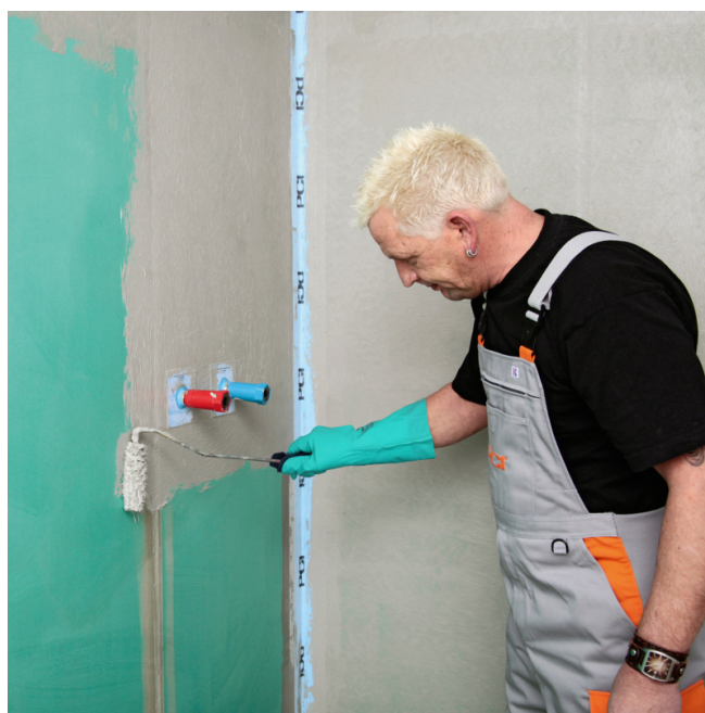
4. Schutzschicht mit PCI Lastogum Dicht unverdünnt satt und oberflächendicht auf den Untergrund auftragen. Nach der Trocknung Vorgang wiederholen und 2. Lage aufbringen.