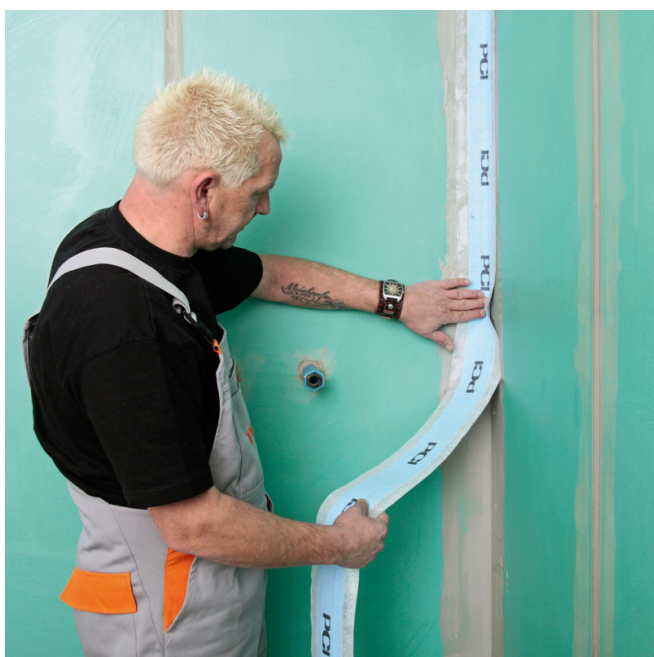
3. PCI Pectape 120 mit PCI Lastogum Dicht in Eckfugen und Boden-Wand-Anschlüsse einkleben.