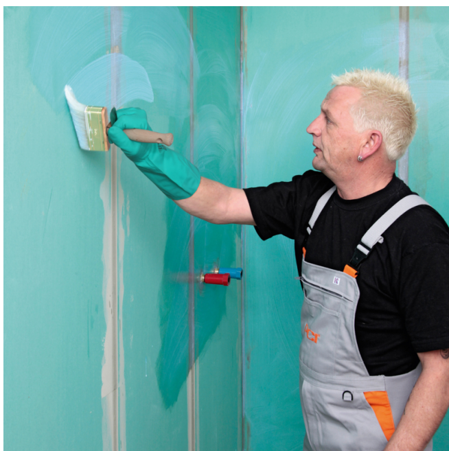
1. Grundieren: Saugende mineralische oder gipshaltige Untergründe und Gipskartonplatten mit PCI Gisogrund All-in-One grundieren.

4 Auf PCI Lastogum Dicht können nach Trocknung an senkrechten und waagerechten Flächen mit PCI Flexkleber Fliesen und Platten verlegt werden.