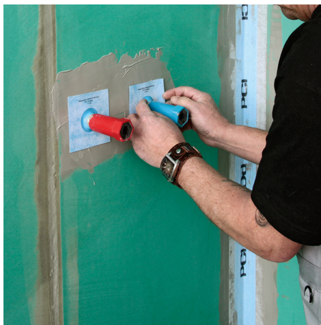
2. PCI Pectape 10 x 10 über den aus der Wand herausstehenden Rohranschluss stülpen und mit PCI Lastogum Dicht verkleben.