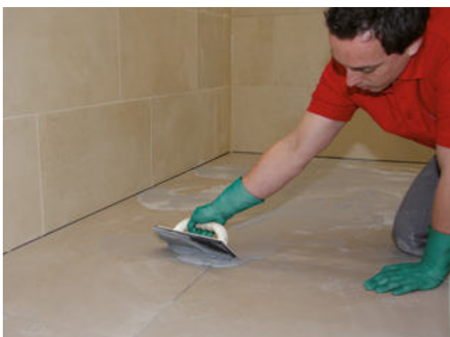
5 Verfugung der Fläche mit einer Sopro Fugenmasse (z.B. Sopro DF 10 DesignFuge Flex, Sopro Brillant Perlfuge)