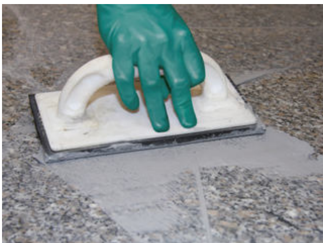
5 Verfugung des verlegten Natursteinbelages mit einer Sopro Fugenmasse (z.B. Sopro DF 10 DesignFuge Flex, Sopro Brillant Perlfuge).