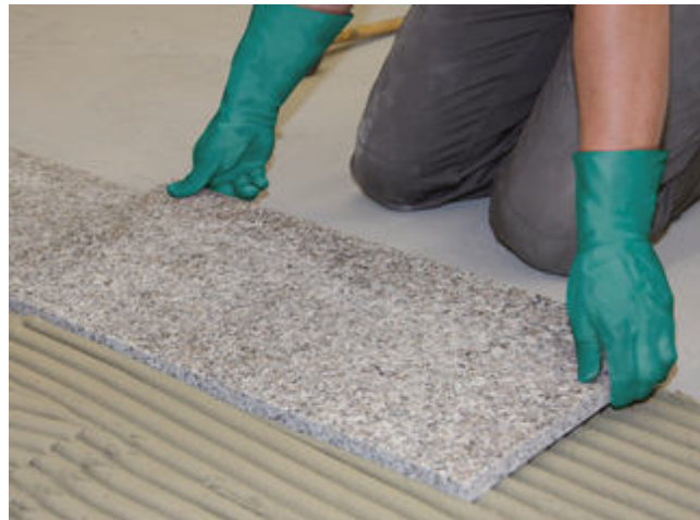
2 Natursteinplatte einlegen und ausrichten. Fugennetz vor der Erhärtung auskratzen.