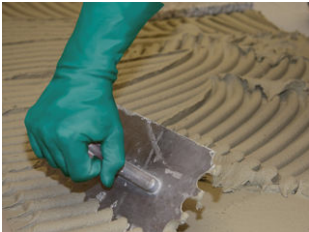
1 Aufziehen des Sopro FKM XL in Mittelbettkonsistenz mit einer Mittelbettkelle auf die vorbereitete Kontaktschicht.