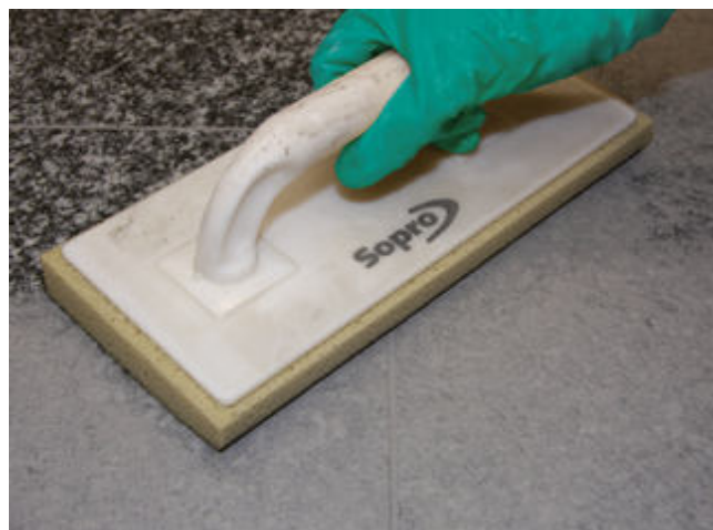
6 Abwaschen des Natursteinbelages nach ausreichender Standzeit der eingefugten Sopro Fugenmasse.