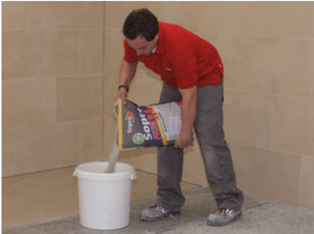
1.1 FKM XL MultiFlexlijm eXtra Light