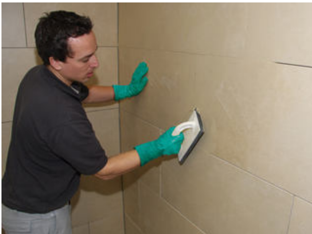
3 Verfugung der Fläche mit einer Sopro Fugenmasse (z.B. Sopro DF 10 DesignFuge Flex, Sopro Brillant PerlFuge)