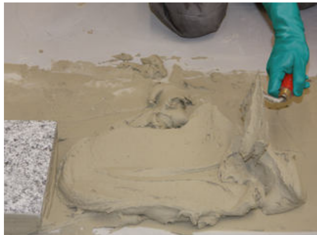
4 Sopro FKMXL ist für höhere Mörtelschichtstärken bis 10 mm auch mit der Kelle Verarbeitbar.