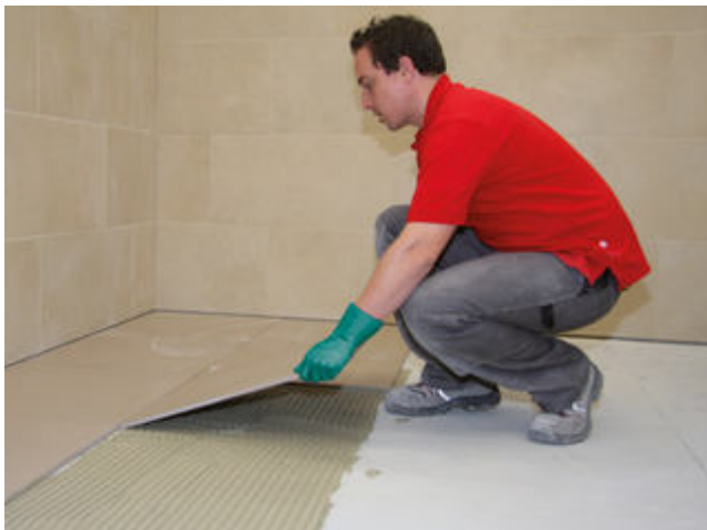
3 Großformatiges Feinsteinzeug einlegen und ausrichten. Fugennetz