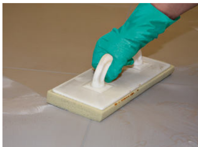
6 Abwaschen des Fliesenbelages nach ausreichender Standzeit der eingefugten Sopro Fugenmasse.