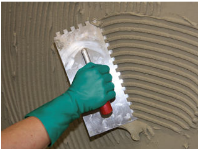
1 Aufziehen des Kammbettes in Wandkonsistenz auf die vorbereitete Kontaktschicht.