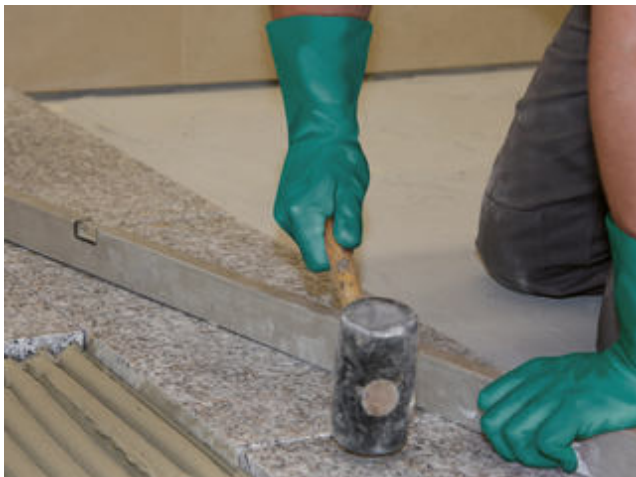
3 Einklopfen der Natursteinplatte und Überprüfung auf Ebenmäßigkeit.