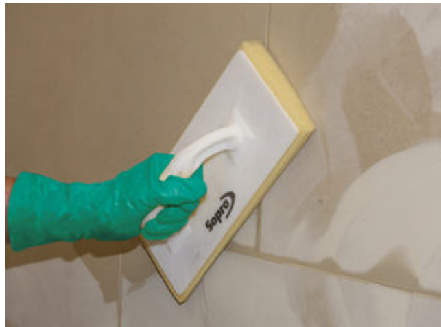
4 Abwaschen des Fliesenbelages nach ausreichender Standzeit der eingefügten Sopro Fugenmasse.