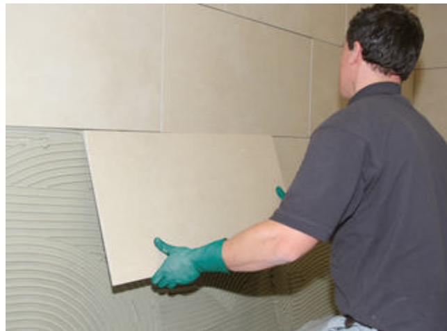
2 Großformatiges Feinsteinzeug einlegen und ausrichten. Fugennetz vor der Erhärtung auskratzen.