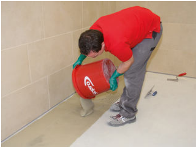
1 Ausgießen des FKM XL in Fließbettkonsistenz auf den vorbereiteten Untergrund.