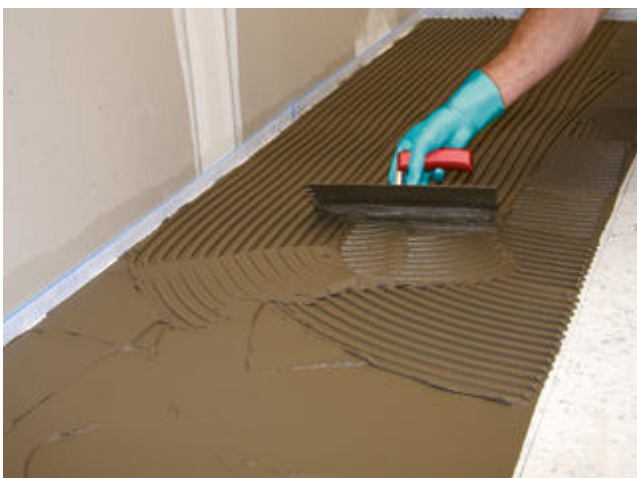
15) Auftrag von z. B. Sopro's No. 1 Flexkleber mit einer Zahnkelle auf die Sopro FliesenDämmplatte für die anschließende Verlegung des keramischen Belages.