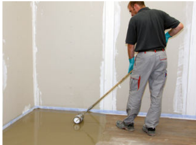
8) Mit einer Stachelwalze wird die aufgebraachte Spachtelmasse verteilt und verdichtet, um eine planebene Oberfläche zu erhalten.