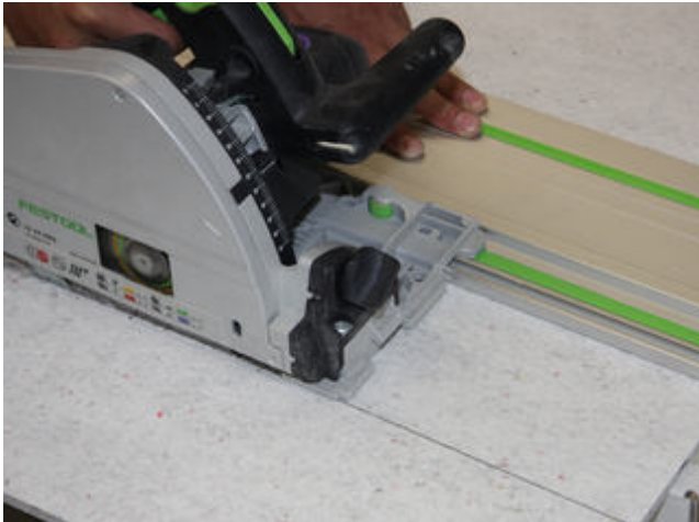
11) Für das Zuschneiden der Sopro FliesenDämmplatte ist z. B. eine Handkreissäge zu verwenden.