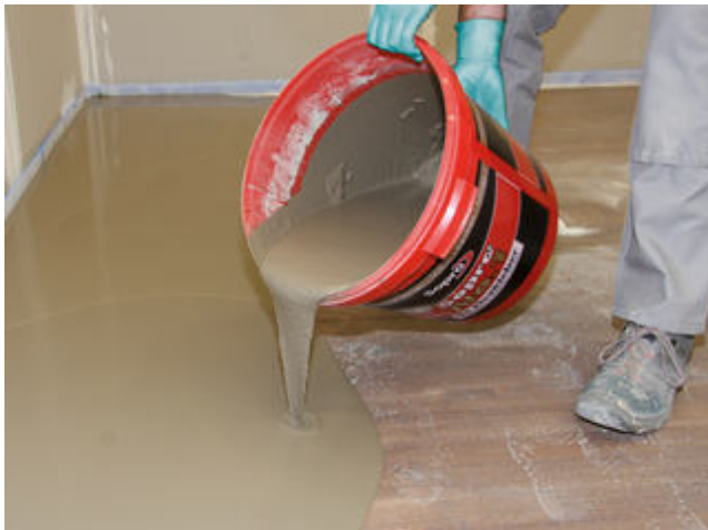
7) Der selbstnivellierende, faserarmierte und flexible Sopro FaserFließspachtel wird im direkten Kontakt zum Holzdielenboden aufgebracht.