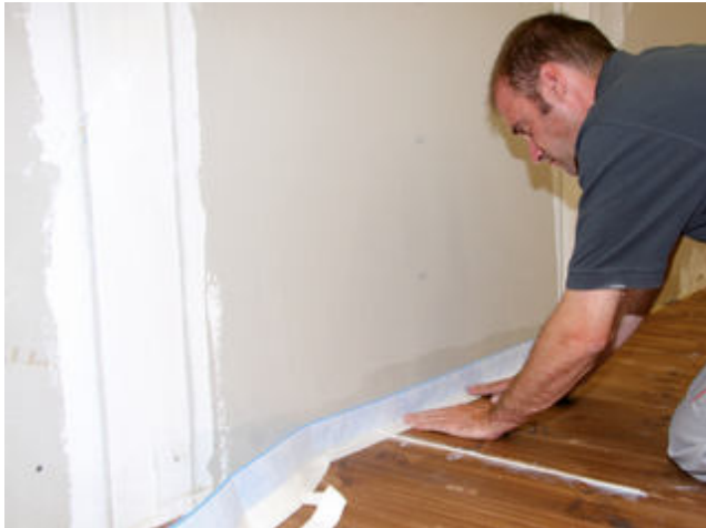
5) Zu allen aufgehenden Bauteilen (Wände) sind Randdämmstreifen, z. B. Sopro RandDämmStreifen, anzuordnen.