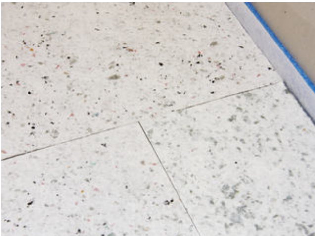
13) Plattenstöße nebeneinanderliegender Reihen werden versetzt verlegt.