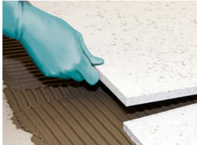
12) Sopro FliesenDämmplatten lassen sich leicht verlegen, da sie nur direkt aneinander gestoßen werden müssen.