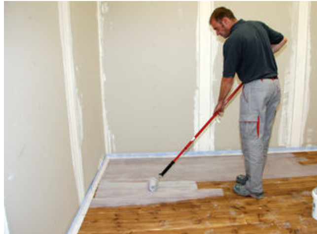
6) Der vorbereitete Holzdielenboden ist mit Sopro HaftPrimerS vorzubehandeln.