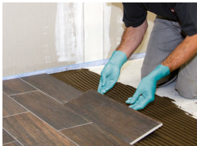
16) Verlegen der keramischen Fliesen in das vorbereitete frische Mörtelbett.