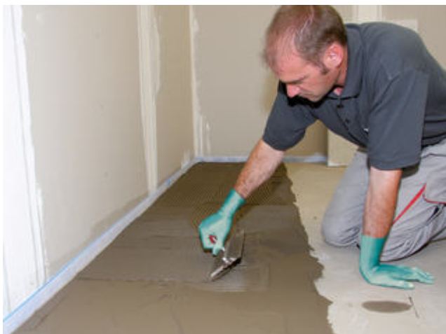
9) Nach Trocknung der Spachtelmasse wird auf den planebenen Untergrund z. B. Sopro's No. 1 Flexkleber aufgetragen.