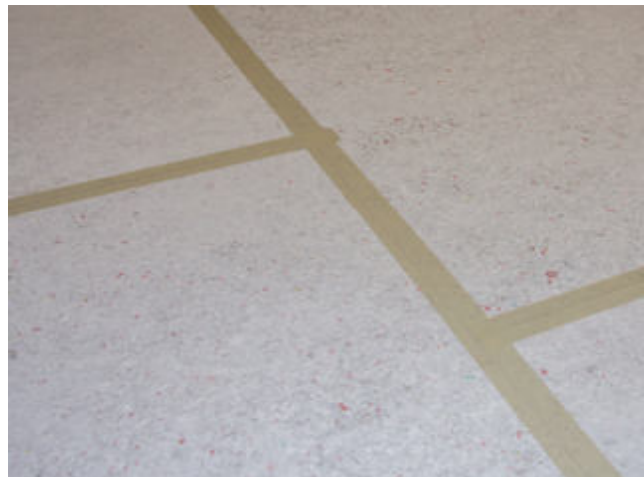
14) Zur Vermeidung von Mörtelbrücken (Körperschallbrücken) werden die Stöße der Platten mit Kleband überklebt.