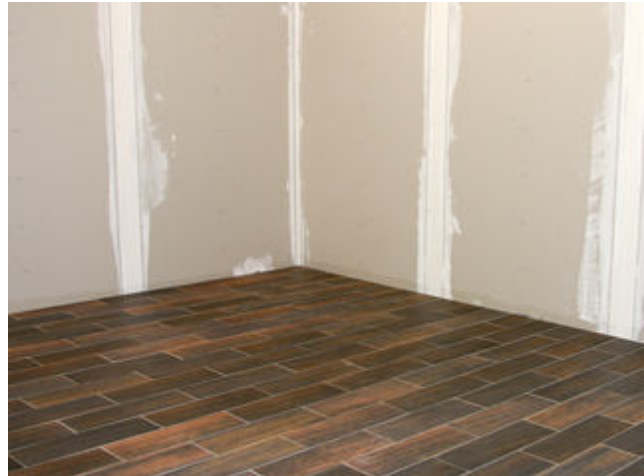
18) Entkoppelter, frisch verlegter und verfugter keramischer Belag auf einem Holzuntergrund.