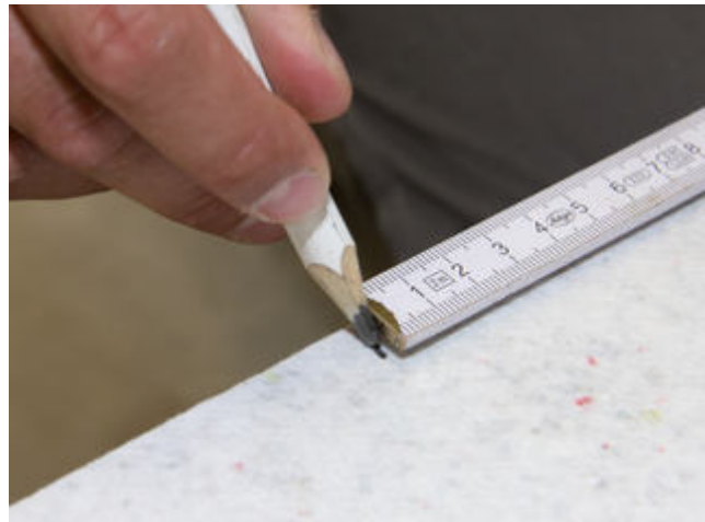
3) Anriss zum maßgenauen Schneiden einer Sopro FliesenDämmplatte.