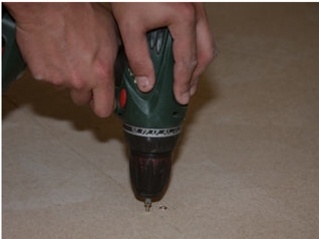
1) Vor der Verlegung der Sopro FliesenDämmplatte auf z. B. Spanplatten, sind die Spanplatten fest anzuschrauben.