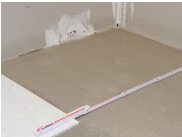
2) Die genaue Vermessung des Raumes vor der Verlegung ist empfehlenswert.