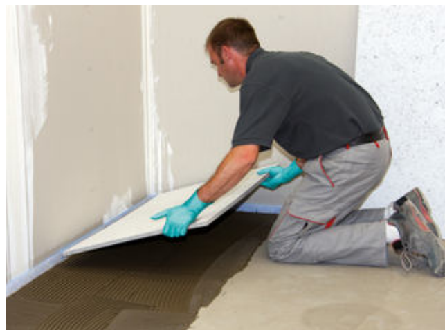
10) Das Einlegen der Sopro FliesenDämmplatte erfolgt vollsatt in das frische Mörtelbett.