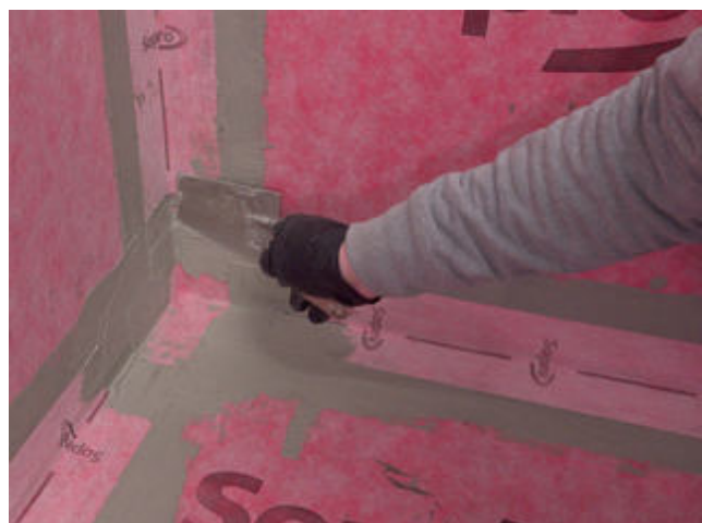
12 Abschlüsse des AEB ® Dichtband Flex (mit Falz) werden im Anschluss mit Sopro Fixier- & DichtKleber oder Sopro DichtSchlämme Flex RS überarbeitet.