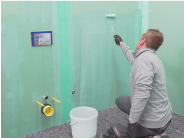
1 Saugende Untergründe mit Sopro Grundierung vorbehandeln.