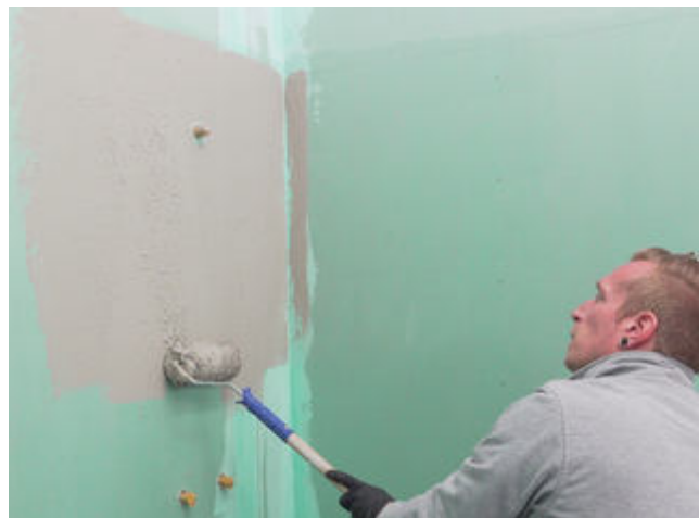
4 Sopro Fixier- & Dichtkleber oder Sopro DichtSchlämme Flex RS vollflächig aufrollen.