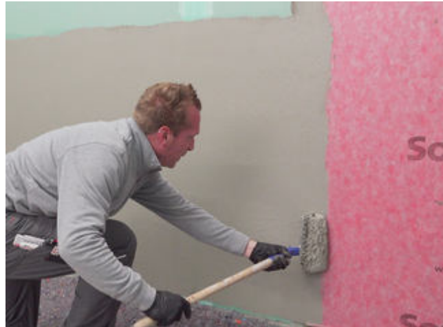
8 Die Überlappungen der Sopro Abdichtungs- und Entkopplungsbahn ca. 5 cm mit Sopro Fixier- & DichtKleber oder Sopro DichtSchlämme Flex RS überarbeiten.