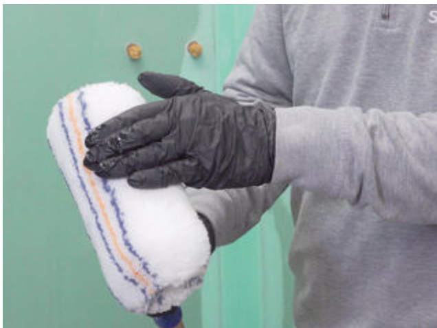
3 Für schnelle Arbeitsfortschritte beim Auftrag eine Lammfellrolle verwenden.