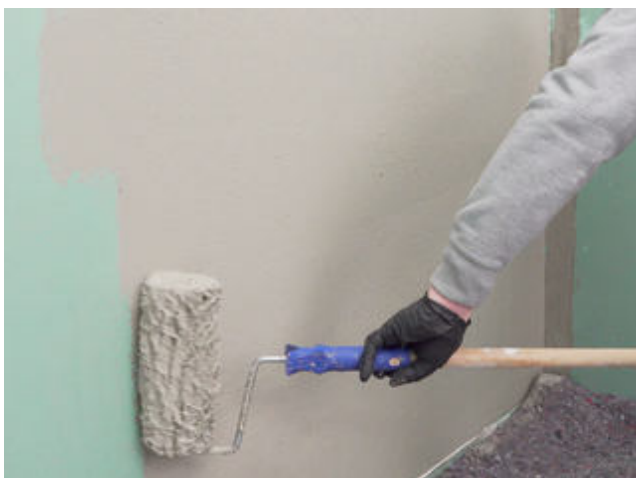
5 Für ein gleichmäßig deckendes Ergebnis Sopro Fixier- & Dichtkleber oder Sopro DichtSchlämme Flex RS im Kreuzgang auftragen.