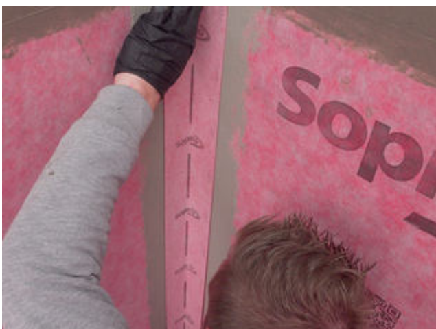
11 Das passgenau zugeschnittene Sopro AEB ® Dichtband Flex (mit Falz) ohne Schlaufenbildung in die frische Klebeschicht einlegen und fest andrücken.