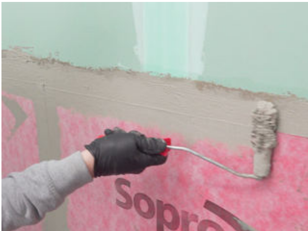
9 Die Abschlüsse der Sopro AEB ® Abdichtungs- und Entkopplungsbahn mit Sopro Fixier- & DichtKleber oder Sopro DichtSchlämme Flex RS überarbeiten.