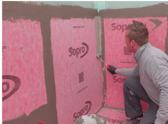
10 Stoßbereiche der Sopro AEB ® Abdichtungs- und Entkopplungsbahn werden mit Sopro AEB ® Dichtband Flex (mit Falz) überarbeitet.