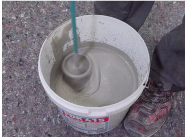
2 FDK 415: Flüssigkomponente vorgeben und mit Pulverkomponente maschinell anmischen. Alternativ: DSF RS im vorgegebenen Verhältnis mit Wasser anrühren.