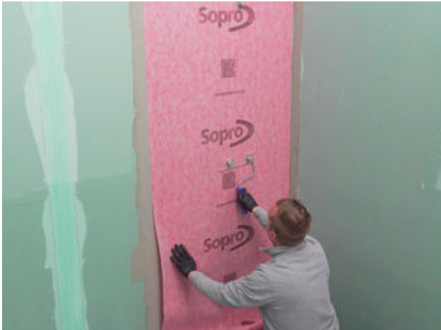
7 Die passgenau zugeschnittene Sopro AEB ® Abdichtungs- und Entkopplungsbahn in die frische Klebeschicht einlegen und von der Mitte her fest andrücken.